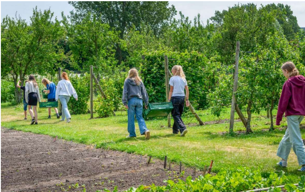
Tuinderij Vrij Waterland

Zaterdag 25 mei 2024 - 10.00 tot 16.00 uur Tuinderij Vrij Waterland & Rudolf Steinercollege