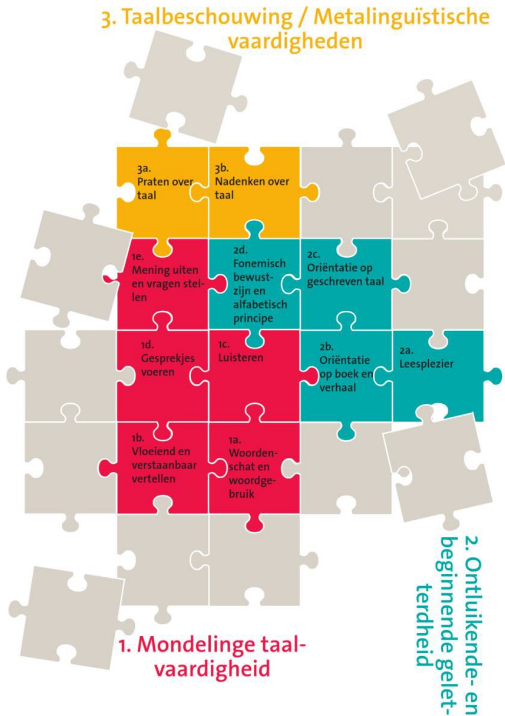
Figuur 1. Taalinhouden voor het jonge kind.